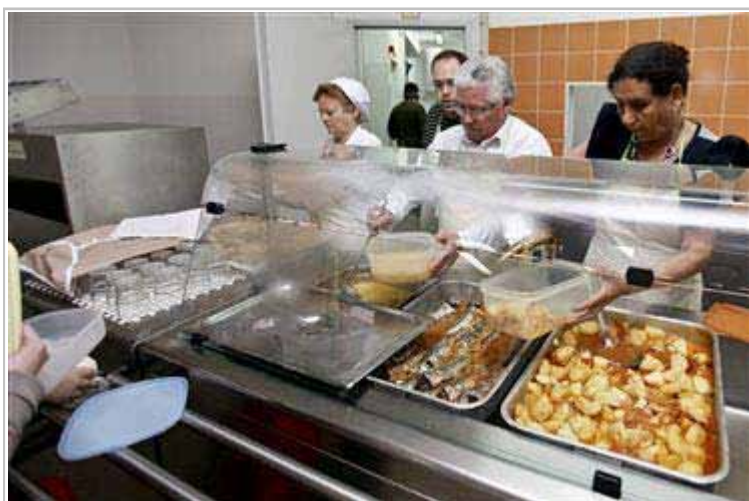
Cheques-refeição favorecem saúde dos trabalhadores e eficiência laboral - Presidente da Edenred